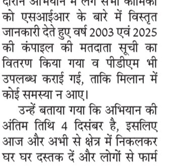
हरिभूमि न्यूज ललितपुर