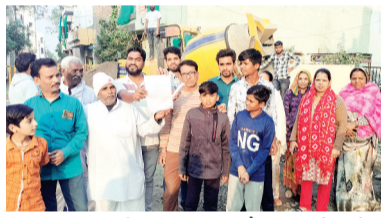
सारांगपुर। कलेक्टर द्वारा अवैध कालोनियों के नामांतरण के साथ अवैध कालोनी में सड़क निर्माण आदि के कार्यों पर रोक लगा रखी है। इसके बाद भी सारांगपुर के सुदर्शन नगर कहलाने वाले मोहल्ले में अलग अलग जमीन मालिकों ने अवैध तरीके से आवास हेतु प्लाट बिक्री की है, लेकिन प्लाट मालिकों को किसी भी प्रकार की मूलभूत सुविधा प्रदान नहीं की। दस से अधिक वर्षों से लोग मकान बनाकर निवासरत हैं। निवारत परिवारों द्वारा स्थानीय निकाय एवं पार्षद पर मूलभूत सुविधा के लिए लगातार दबाव बनाया, इसी के चलते उक्त कालोनी में नगर पालिका द्वारा सड़क निर्माण प्रारंभ किया लेकिन मोहल्लेवासियों के साथ जो धोखा

कालोनी काटने वालों ने किया वही धोखा सड़क निर्माण ठेकेदार द्वारा किया जा रह रहा है।