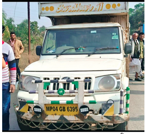
हरिभूमि न्यूज ॥ ब्यावरा-सुजालिया